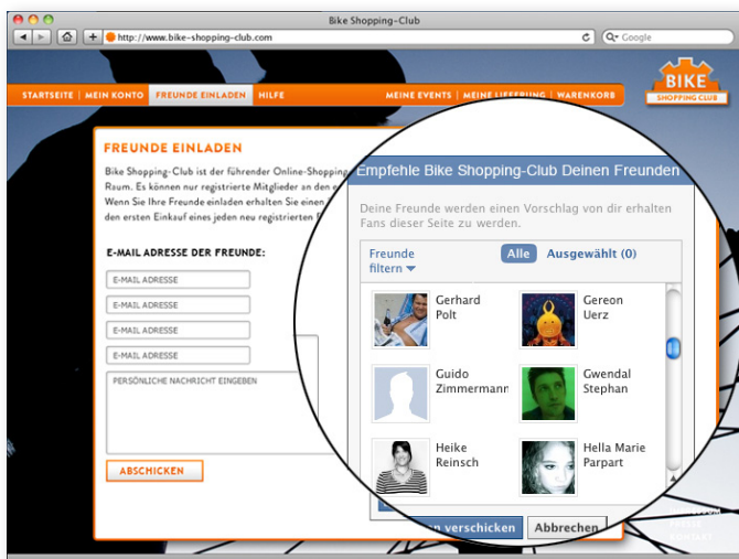
Darstellungsbeispiel Facebook Integration

Ihren Freunden teilen sie über den „Gefällt-mir“-Button mit, welche Artikel sie mögen. Die „Share“-Funktion erlaubt, Videos und Artikel-Fotos ins Facebook-Profil zu laden. Das „Facepile“-Plugin zeigt Bilder der Nutzer, die Fan der Facebook-Shopseite sind.